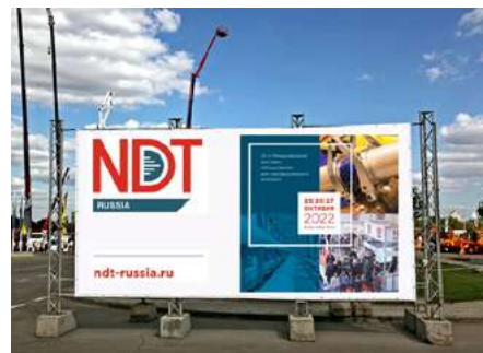
Рекламная конструкция «прямоугольник» со стороной 2x3 м